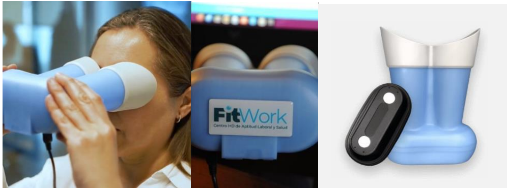
Figura 2: Sensor utilizado para captura de imágenes

Nuestros resultados son presentados en una escala de tres colores para una forma simple de operación.